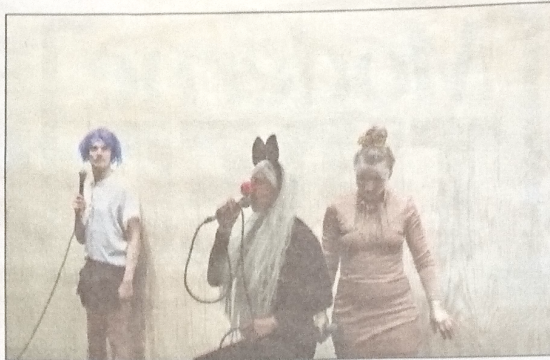
Å VÆRE ELLER LA VÆRE: Det er spørsmålet i Verk produksjoners «Beat the Drum: Wishful beginnings».